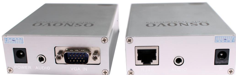
Рис.1 Внешний вид TA-U1+RA-U1