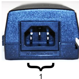
Рис. 2. Инжектор Midspan-1/190A , Midspan-1/300A Midspan-1/300G , вид сзади