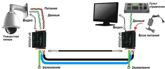
Рис. 3 Подключение SP-CPD/220