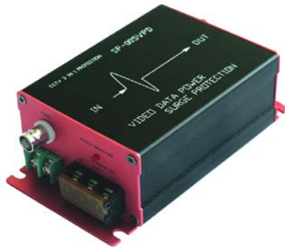
Рис. 1 Внешний вид SP-CPD/220