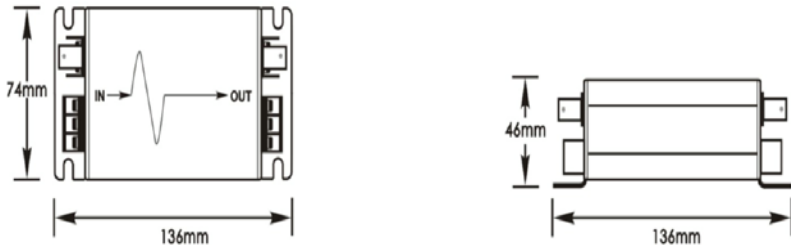
Рис. 2 Габаритные размеры SP-CPD/220