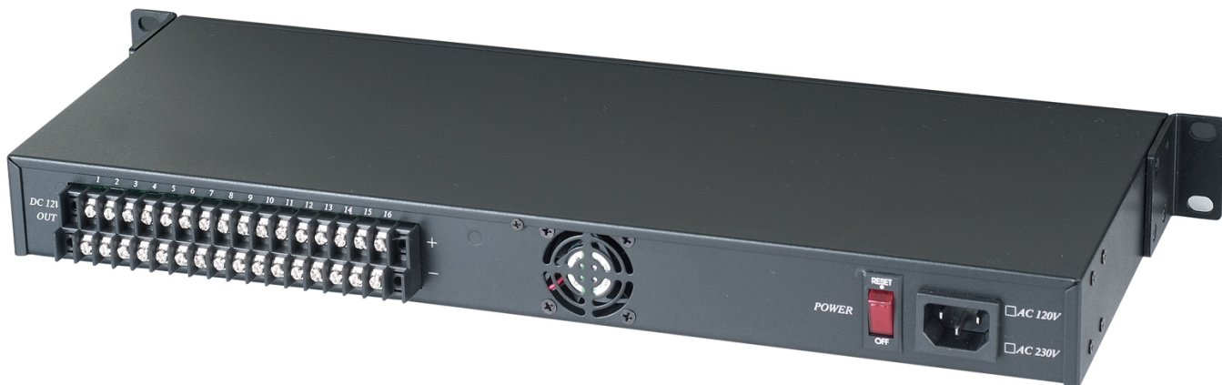
Рис. 2 Задняя панель блока питания PR1616-12R