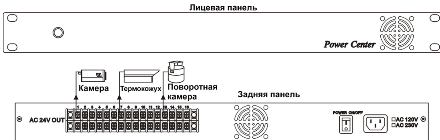
Рис. 3 Схема подключения блока питания PR1616-12R

Примечание: каждый из выводов блока питания оборудован электронным предохранителем, который в случае короткого замыкания или перегрузки по току (более 1,1 А) размыкает электрическую цепь. Прибор перезапускается автоматически, после выявления и устранения причины короткого замыкания или перегрузки.