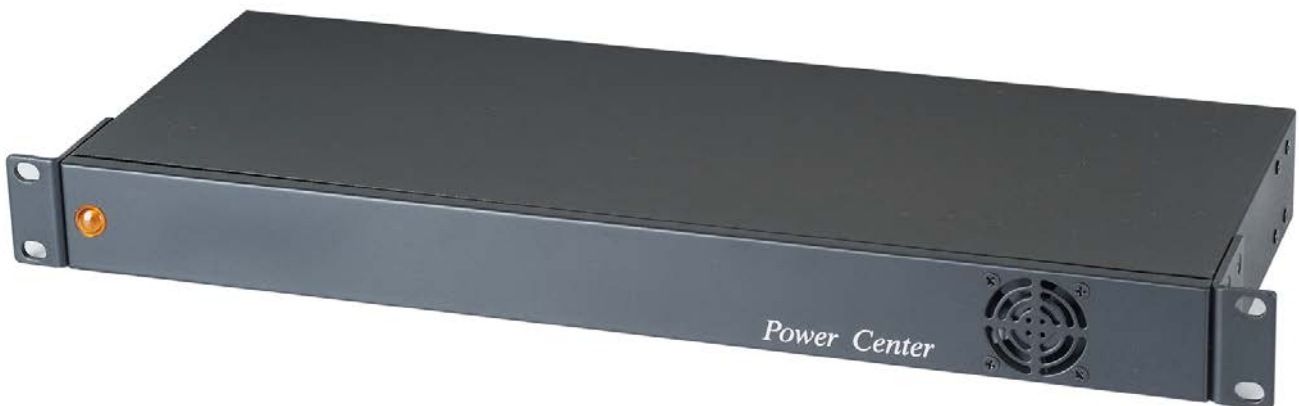
Рис. 1 Лицевая панель блока питания PR1616-12R