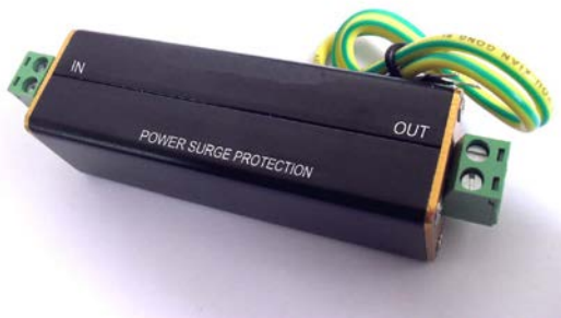
Рис.1 Внешний вид SP-DC/12, SP-DC/24, SP-DC/48