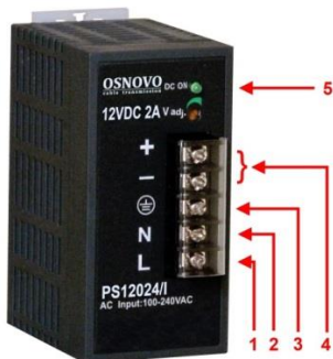
Рис. 1. Блок питания PS-12024/I, PS-48048/I