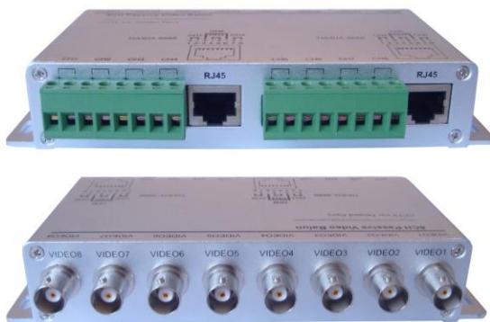
Рис.1 Внешний вид TP-C8