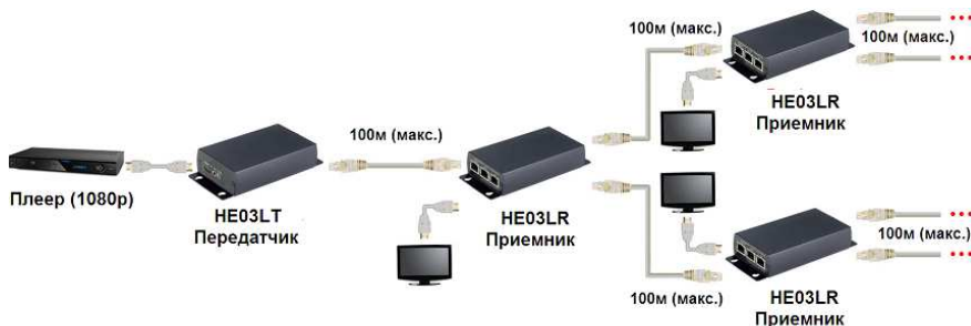
Рис. 3 Схема подключения HE03L