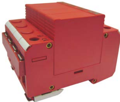
Рис.1 Внешний вид SP-AC3D/220-4, SP-AC3D/220-5