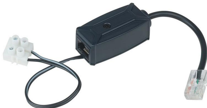
Рис. 1 Внешний вид PoE-адаптера EP01.