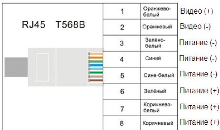
Рис.5 Распиновка разъемов RJ45