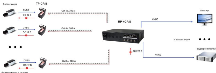
Рис. 4 Схема подключения TP-CP/S к RP-4CP/S, RP-8CP/S, RP-16CP/S