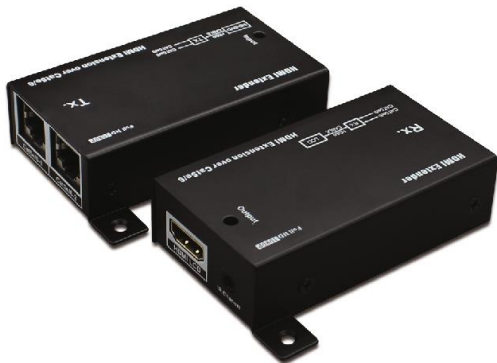
Рис. 1 Вид устройства комплекта TA-Hi/2+RA-Hi/2.