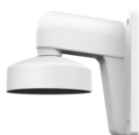
DS-1272ZJ-110 Настенный кронштейн