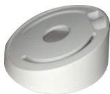
DS-1259ZJ Потолочное крепление