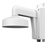
DS-1272ZJ-110B Настенный кронштейн