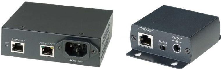
Рис.1 Внешний вид инжектора IP05I и сплиттера IP05S.