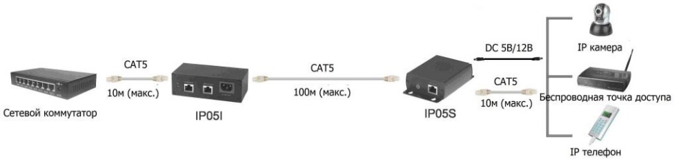
Рис.2 Схема подключения инжектора IP051 и сплиттера IP05S.