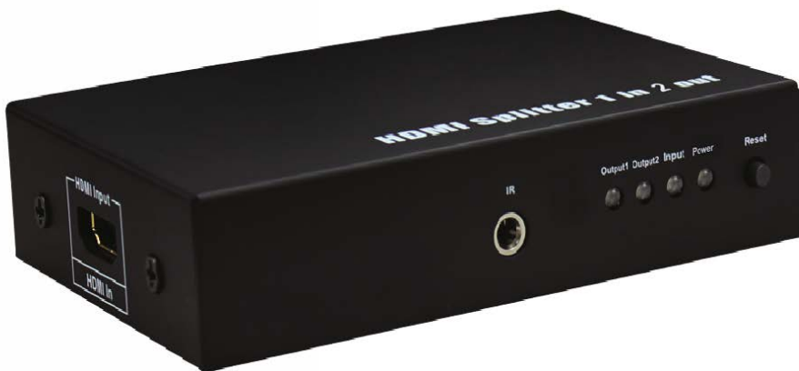
Рис. 1 Разветвитель D-Hi102/mini, вид спереди.