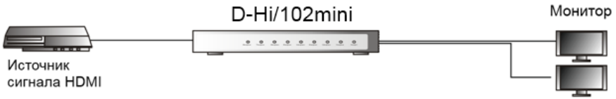
Рис. 3 Схема подключения разветвителя D-Hi102/mini