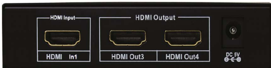
Рис. 2 Разветвитель D-Hi102/mini, вид сзади.