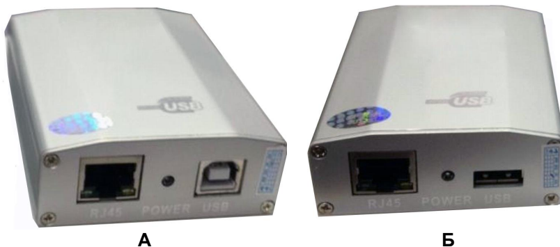
Рис.1 Внешний вид TA-U1/3 (A)+RA-U1/3(Б)