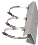
DS-1275ZJ Крепление на столб