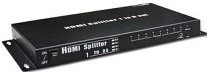
Рис.1 Разветвитель D-Hi108/cascad, вид спереди